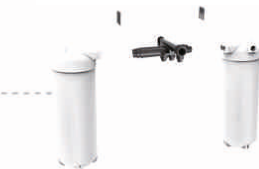
BR15L-B- Йонообменна смола

Нивото на сол е видимо през прозорец. Контейнерът може да бъде изтеглен навън за почистване.