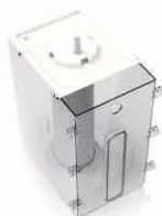
Място за добавяне на сол

Може да се премести на всяка една страна на машината, както и да бъде фиксиран вертикално ако няма място.